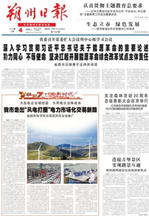
2019年6月4日朔州日报网络版截图