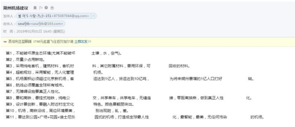
图 2.3-1 热心公众对项目选址咨询和建设建议的截图