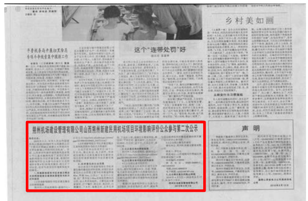
2019年6月4日朔州日报纸质版截图