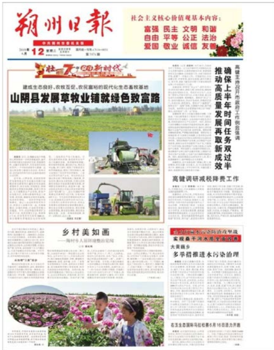
2019年6月12日朔州日报网络版截图