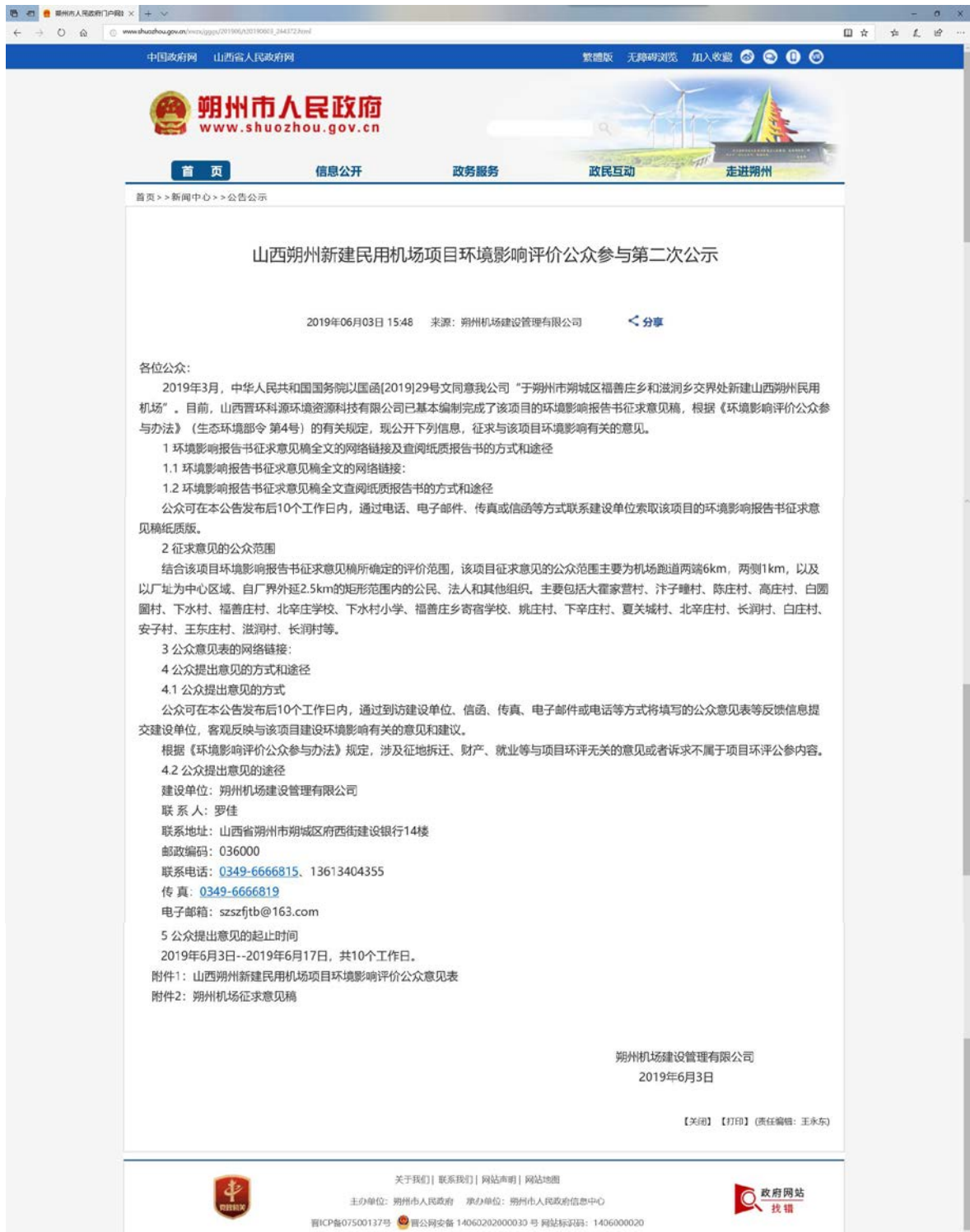
图 3.2-1 环境影响评价公众参与第二次公示（网络平台）