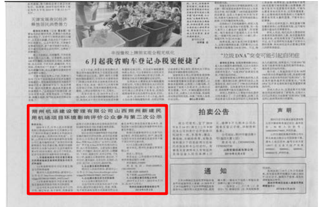
2019年6月4日朔州日报纸质版截图