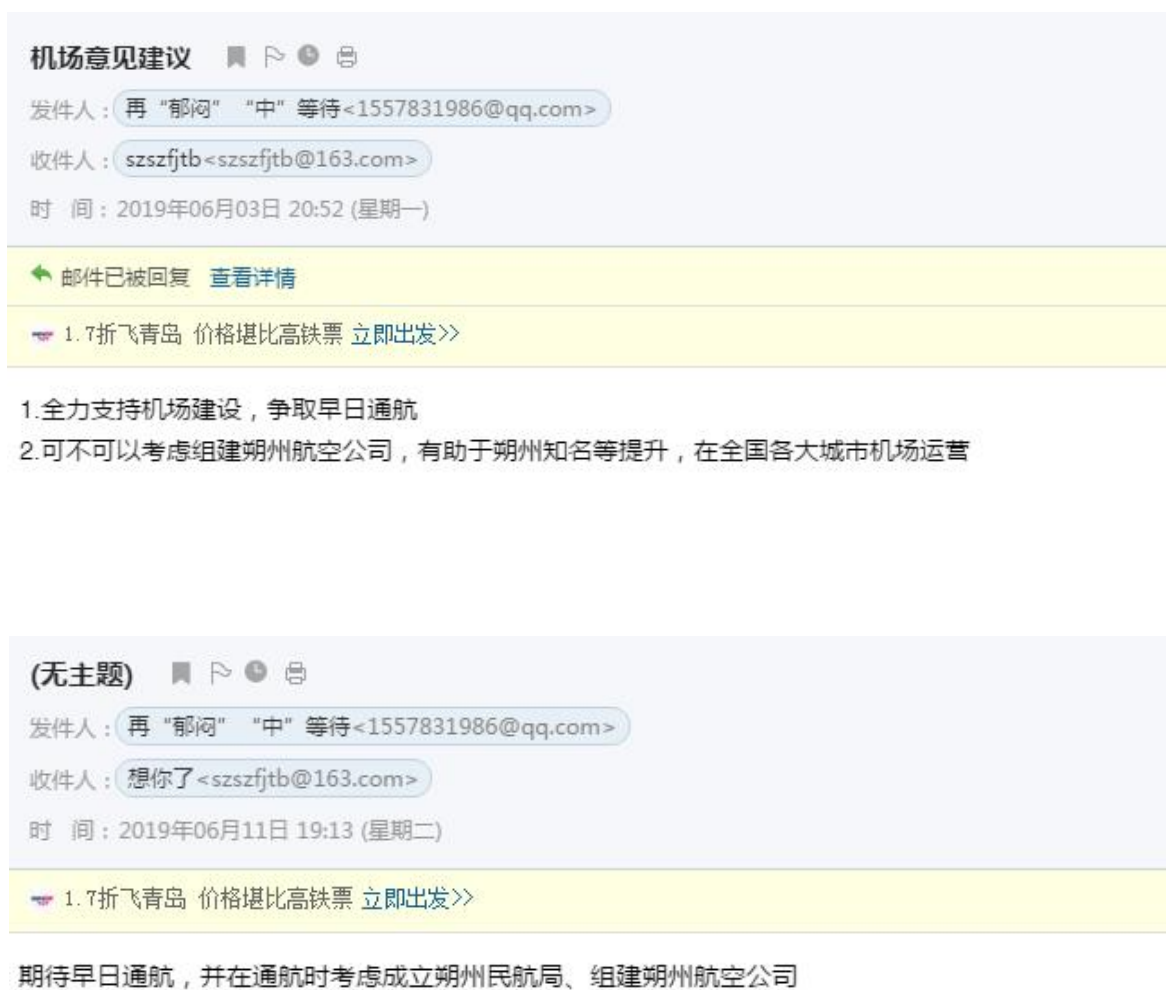
图 3.4-1 热心公众对项目建设建议的截图